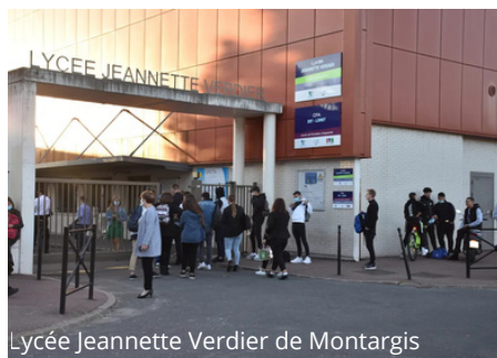
Lycée Jeannette Verdier de Montargis

Toutes ces actions aident les élèves de 3 e à mieux réfléchir à leur orientation et à leur futur choix scolaire.