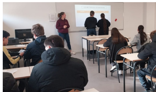
Découverte des cours et enseignements proposés