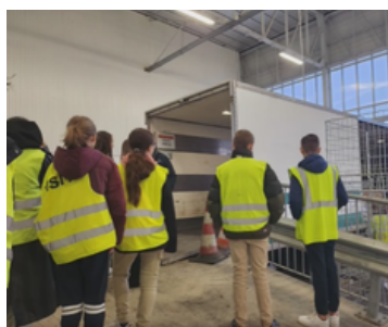
Visite des locaux et ateliers du Lycée Jeannette Verdier