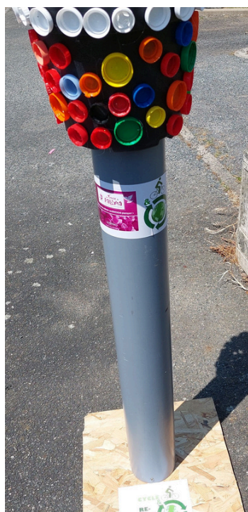
Récolte de bouchons

C'est pour cette raison, que l'association « Les tracas de Paloma » a été créée. En collectant puis en revendant les bouchons en plastiques pour recyclage, la famille récupère des fonds pour l'aider à payer ces frais. Alors, mobilisez vous en rapportant à la vie scolaire du collège vos bouchons en plastiques (voir illustration).