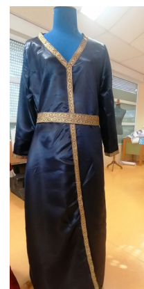
Robe de mariée bleue