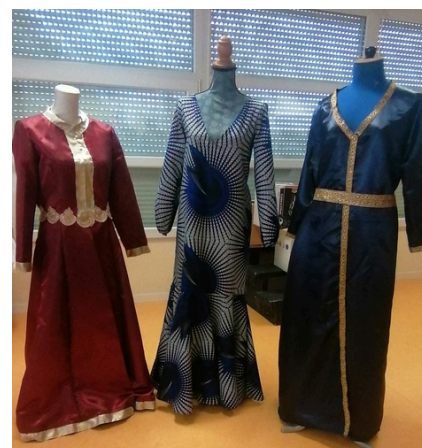
Robes de mariées

Oui, les anciens fauteuils ont été démontés, les housses bleues en tissu ont été retirées et remplacées par des nouvelles housses à motif en Wax. le wax est un textile traité à la cire ce qui lui permet d'être plus résistant. Un panneau explicatif a été installé et détaille toutes les étapes.