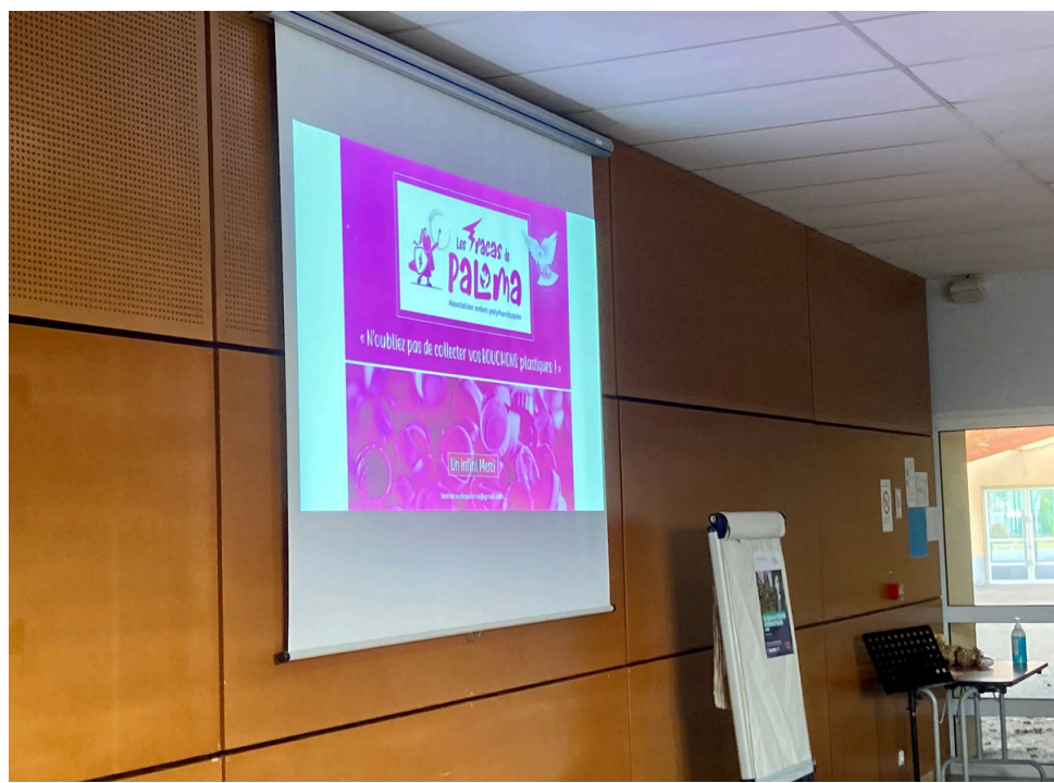
Association "les tracas de Paloma"