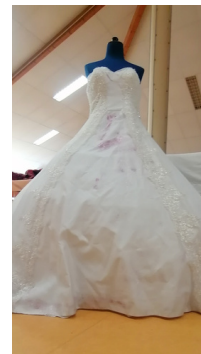
Robe de mariée blanche

“ De nombreuses robes traditionnelles venant du monde entier ont été confectionnées ”