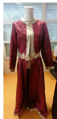
Robe de mariée rouge